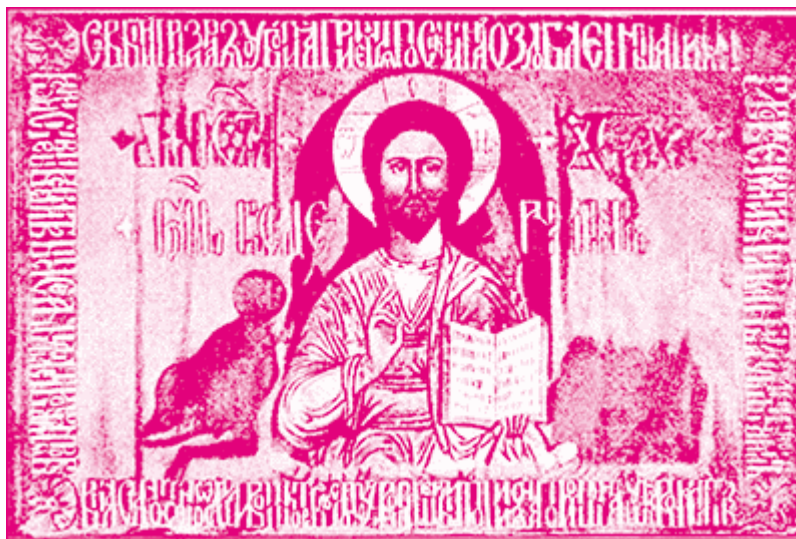
Стяг князя Д. М. Пожарского. Хранится в Московской Оружейной палате

Но земское ополчение не решилось штурмовать Кремль; сидевшая там горсть поляков сдавалась сама, доведенная голодом до людоедства. Казацкие же атаманы, а не московские воеводы отбили от Волоколамска короля Сигизмунда, направлявшегося к Москве, чтобы воротить ее в польские руки, и заставили его вернуться домой. Дворянское ополчение здесь еще раз показало в Смуту свою малопригодность к делу, которое было его сословным ремеслом и государственной обязанностью.