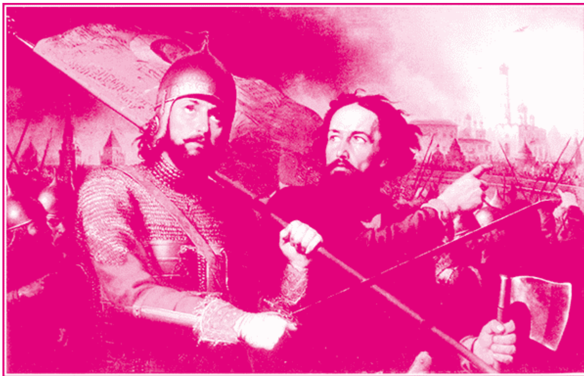
М. И. Скотти. Минин и Пожарский

Второе ополчение. В конце 1611 г. Московское государство представляло зрелище полного видимого разрушения. Поляки взяли Смоленск; польский отряд сжег Москву и укрепился за целевшими стенами Кремля и Китая-города; шведы заняли Новгород и выставили одного из своих королевичей кандидатом на московский престол; на смену убитому второму Лжедмитрию в Пскове уселся третий, какой-то Сидорка; первое дворянское ополчение под Москвой со смертью Ляпунова расстроилось. Между тем страна оставалась без правительства. Боярская дума, ставшая во главе его, по низложению В. Шуйского, упразднилась сама собою, когда поляки захватили Кремль, где сели и некоторые из бояр со своим председателем князем Мстиславским. Государство, потеряв свой центр, стало распадаться на составные части; чуть не каждый город действовал особняком, только пересылаясь с другими городами. Государство преобразалось в какую-то бесформенную, мятущуюся федерацию.